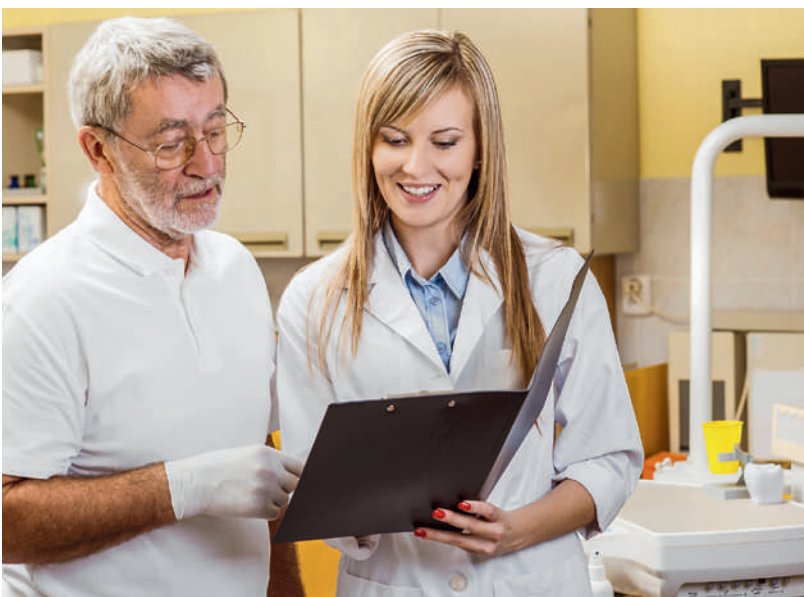
Grosses Interesse besteht an der Weiterbildung zur Medizinischen Praxiskoordinatorin (MPK). Im Dezember finden erste Prüfungen statt.

Das Projekt der Weiterbildung und des weiteren Berufsaufstiegs für MPA, die Berufsprüfung MPK, erfuhr einen guten Abschluss. Nach langen Jahren der Entwicklung und Verbesserung der ersten Ideen sowie